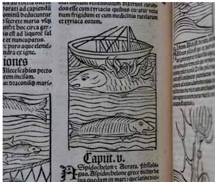
Vooral in de vastentijd hield de adel van gezouten walvisvlees

Met de rapporten wil de Provincie haar promotiestrategie voor de Zwinstreek verbreden. Tot nog toe stelde ze vooral scherp op troeven zoals natuur (met o.a. het Zwin Natuurpark) en erfgoed (de historische steden, de oude dijken, de bunkerlinies). Toch herbergt de streek rond Brugge, Damme, Knokke en Sluis ook een zeer hoge concentratie van topchefs en sterrenrestaurants, wat van gastronomie een sterke troef maakt. En misschien hangt dat wel samen met de agrarische identiteit van de regio en met typische streekproducten?