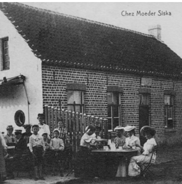
De eetcultuur is al langer nauw met de Zwinstreeks verbonden.