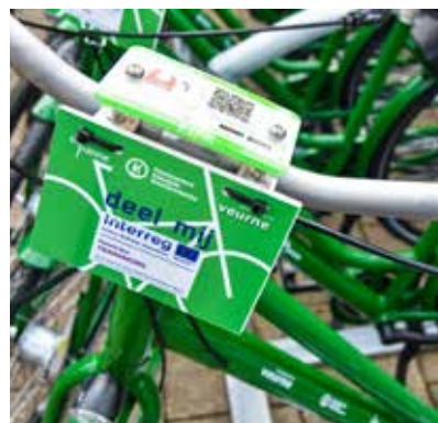
De deelfietsen zijn uitgerust met een slim fietsslot.