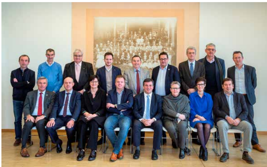
De raad van bestuur van DVV Westhoek.

bestuur. In december 2019 kreeg het strategisch plan dan groen licht in de algemene vergadering van de DVV Midwest.