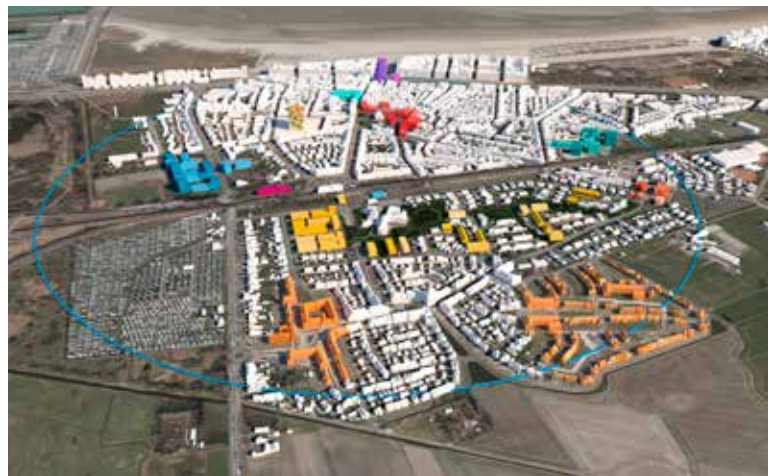
De strategische visie reikt beleidsdoelen aan voor de lange termijn: waar mag er nog worden gebouwd, hoe vrijwaren we de open ruimte, hoe kunnen we kwaliteitsvol verdichten enz.?

WVI is samen met de gemeente Knokke-Heist begonnen met de opmaak van een ruimtelijk beleidsplan. Daarmee wil de gemeente slagvaardiger en daadkrachtiger inspelen op ruimtelijke uitdagingen van morgen. Een schets van conceptnota werd alvast aan de inwoners voorgelegd.