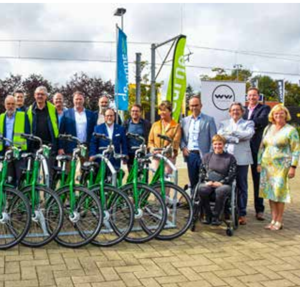
Burgemeesters, schepenen en mobiliteitsambtenaren van De Panne, Koksijde en Veurne samen met afgevaardigden van WWI bij de lancering van het project.

met de drie gemeenten: we begeleiden onder meer de aanbestedingen voor lokale fietshandelaren en volgen tijdens de proefperiode ook de monitoring op.