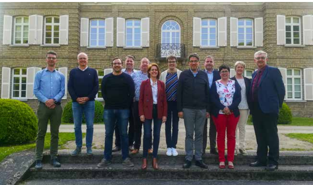
De raad van bestuur van DVV Westhoek.