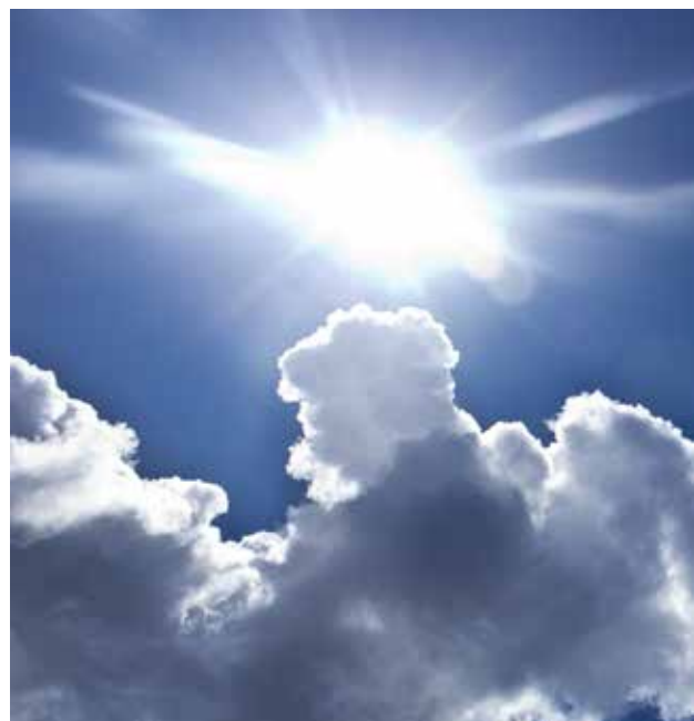
Een lokaal gezondheidsplan warme dagen bundelt alle acties die de gezondheid van de inwoners beschermen tijdens warme dagen.