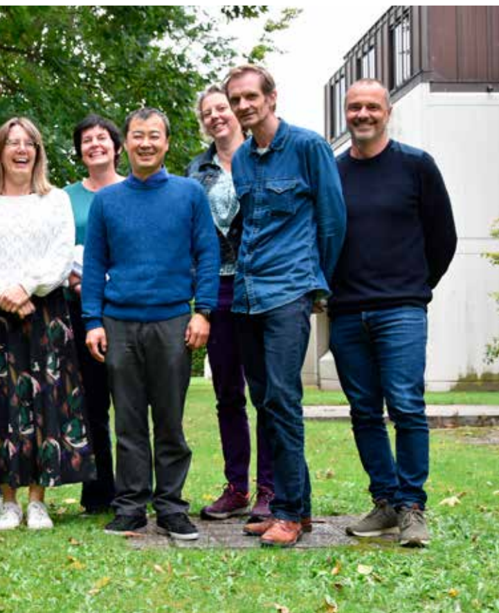
De KDV GIS bestaat uit 2 intergemeentelijke GIS-coördinatoren en een pool van GIS-operatoren.