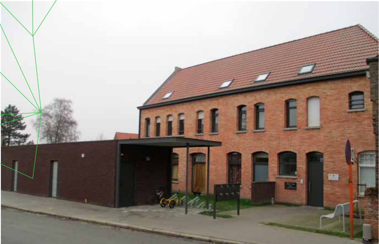
Hoe je gemeentelijk erfgoed een nieuwe bestemming kunt geven, toonde WVI al in 2012: in een voormalig klooster in Voormezele realiseerden we samen met de Stad Ieper 7 sociale woningen.