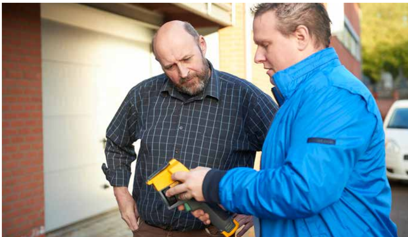
Inwoners die een thermografische gevelscan laten uitvoeren, kunnen energieadvies op maat krijgen.