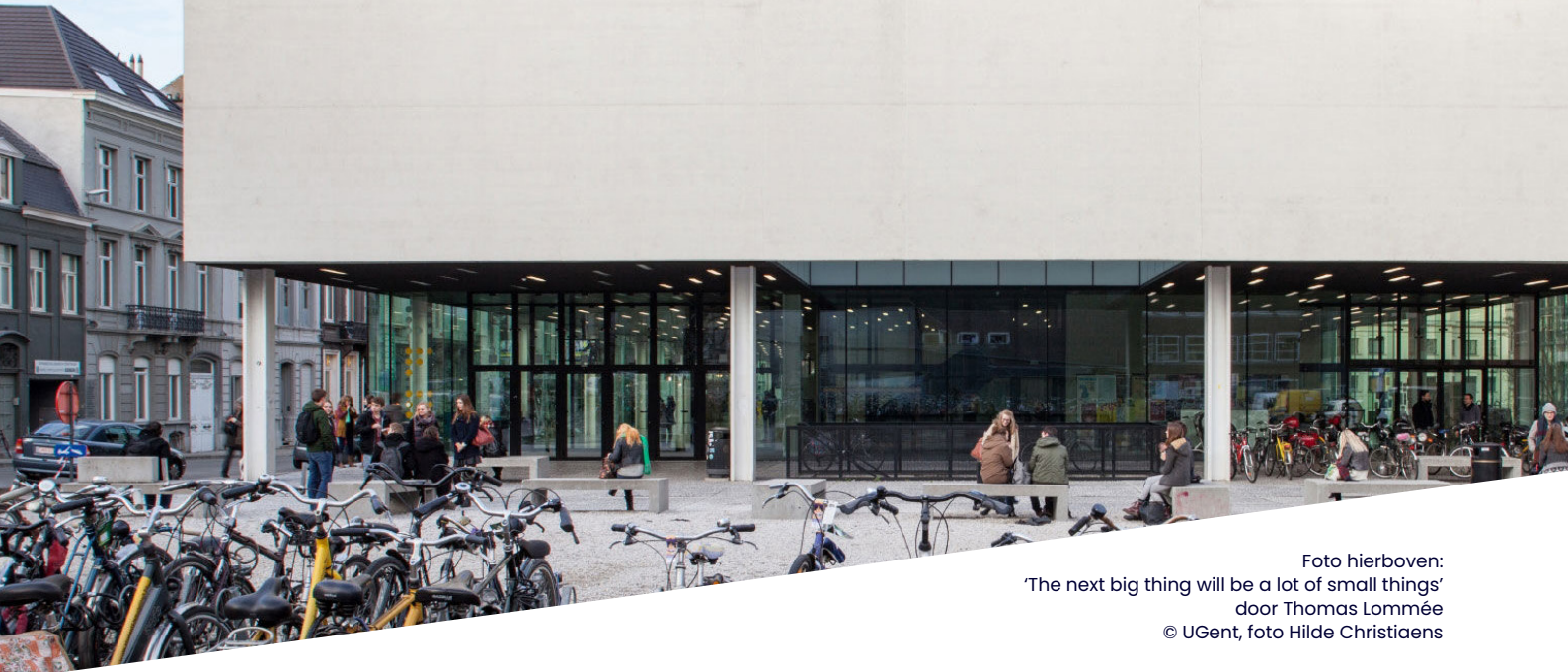
Foto hierboven: 'The next big thing will be a lot of small things' door Thomas Lommée

The next big thing will be a lot of small things.